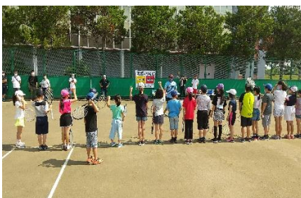
総合型地域スポーツクラブ活動推進事業