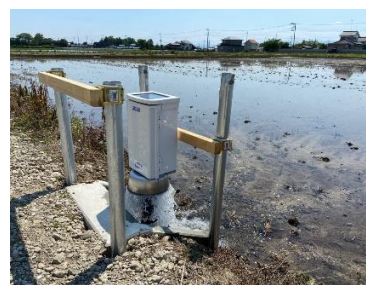
次世代農業推進事業（水田自動給水システム）