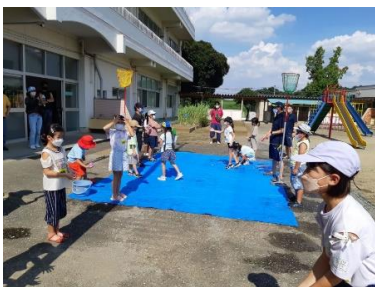
地域学校協働活動推進事業